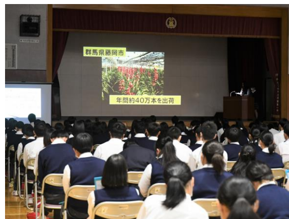
プロジェクト発表(フローラルライフコース)