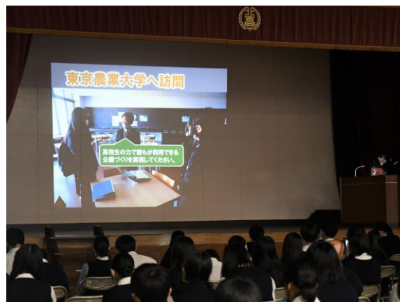
プロジェクト発表(ガーデニングコース)

今後、入賞者の中から県大会規定の発表分野に則して考慮を行い学校代表が選ばれます。代表者には、伊勢崎市境総合文化センターで開催の県大会での健闘を期待します。