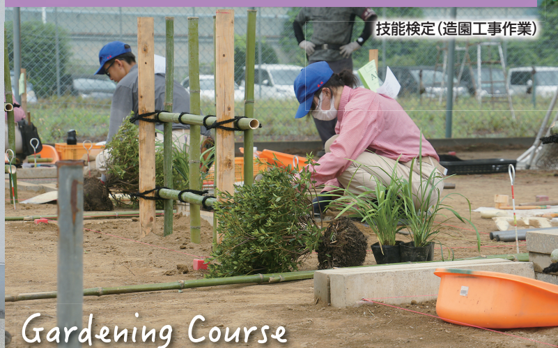
技能検定(造園工事作業)

自然材料を生かした生活・地域空間のデザインや設計に関する基礎的・基本的な知識・技術を学習します。また、緑と花に囲まれた美しく持続可能な生活環境・地域環境・アメニティ空間の創造に主体的に取り組む能力と態度を育てます。