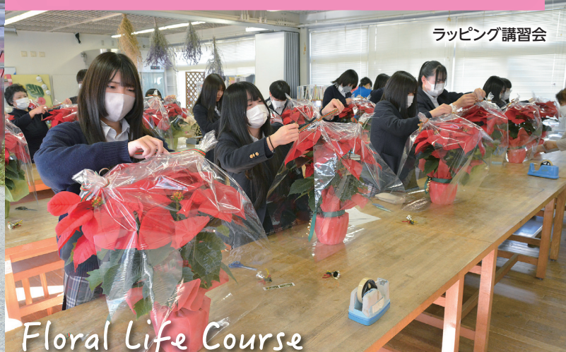
ラッピング講習会

草花園芸に関して栽培から活用まで幅広く学習します。また、それらを活用して、美しく豊かな生活環境や地域社会の創造に主体的に取り組む能力と態度を育てます。