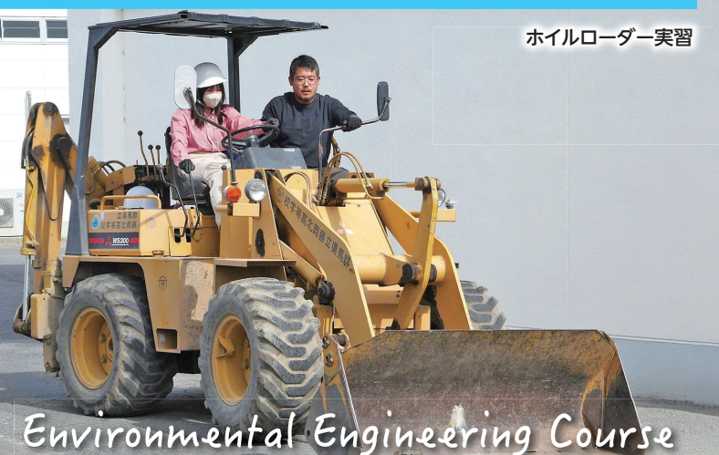
ホイローダー実習

環境や土木工学に関する基礎的・基本的な知識・技術を学習します。また、生態系の保全、自然と調和した持続可能な豊かな景観と地域環境の創造に主体的に取り組む能力と態度を育てます。