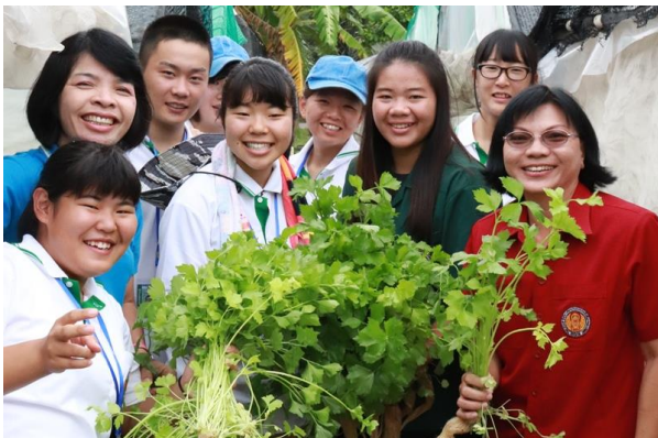
ミニセロリの収穫を体験

6名はコンケン農業技術校に宿泊して、さまざまな学習や交流を行ったほか、史跡や博物館の見学、近郊の農家の視察なども体験しました。これらの活動を通じて、タイ王国の文化に触れることができ、また日本とは異なった気候風土の中で行われている農業に接することができ、貴重な体験ができました。