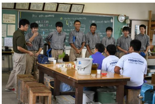
モルタル文鎮作り