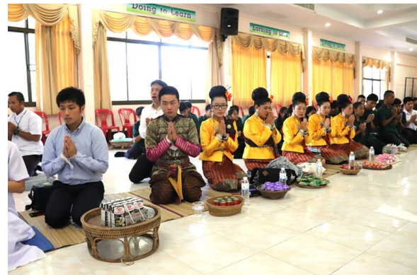
タイの伝統的な衣装を身につけての托鉢体験