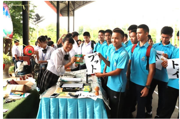
タイの皆さんに毛筆で名前を書いてプレゼント

参加者は、「タイのダンスをしたり、民族衣装を着るなど貴重で楽しい経験ができた。」「この経験を今後の高校生活や人生に活かしていきたい。」と