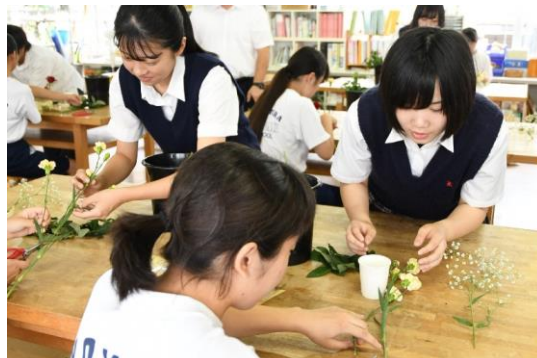
フラワーアレンジメント作り