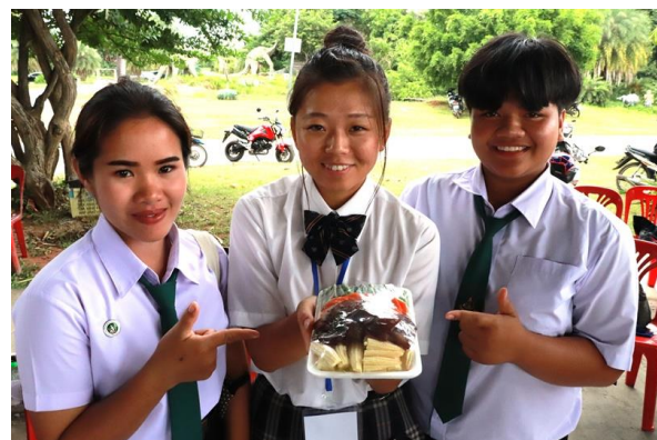
野菜のパッケージコンテストにも参加

なお、10月28日から11月16日にかけて、コンケン農業技術校の生徒2名と先生2名が藤岡北高校を訪れる予定です。