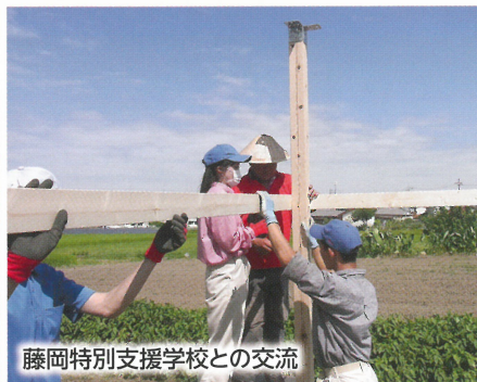
藤岡特別支援学校との交流