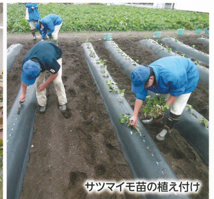
サツマイモ苗の植え付け