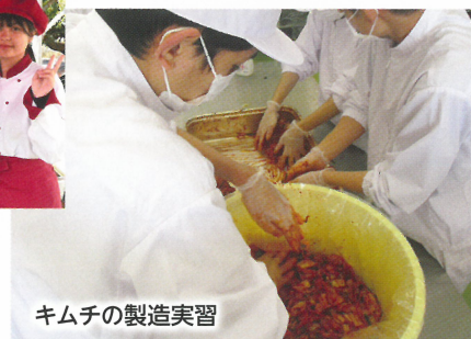
キムチの製造実習