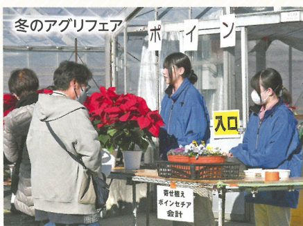
冬のアグリフェア