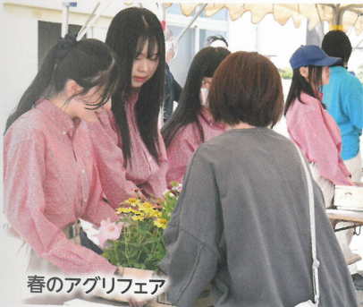
春のアグリフェア