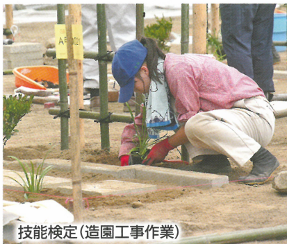
技能検定(造園工事作業)