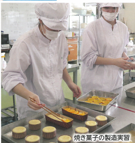
焼き菓子の製造実習