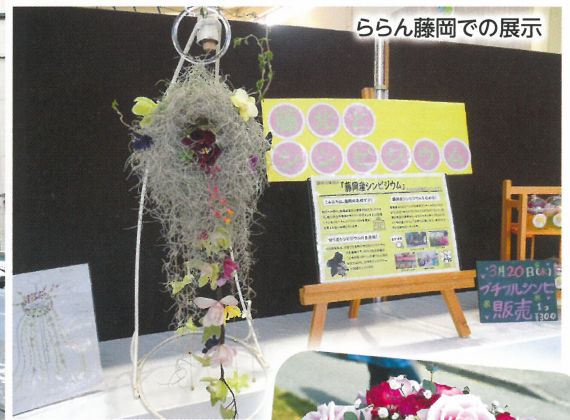
ららん藤岡での展示