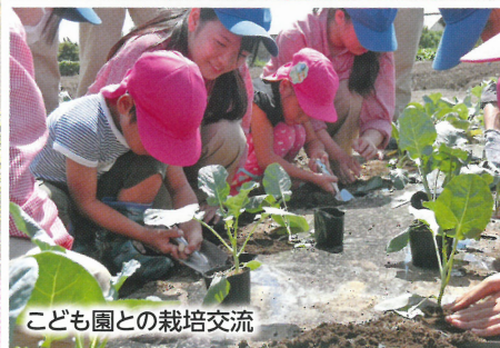
こども園との栽培交流