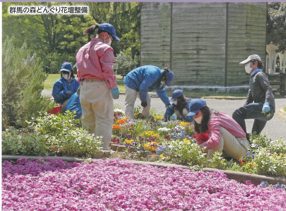
群馬の森どんぐり花壇整備