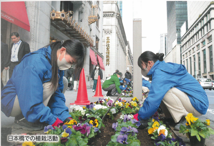
日本橋での植栽活動