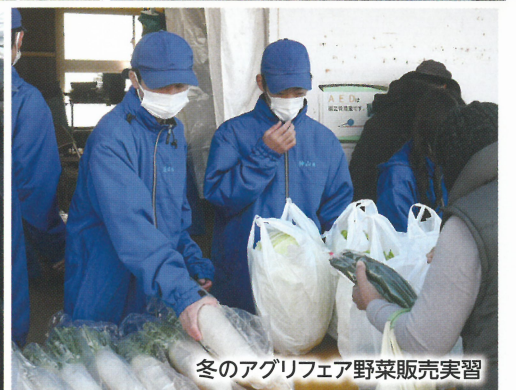
冬のアグリフェア野菜販売実習