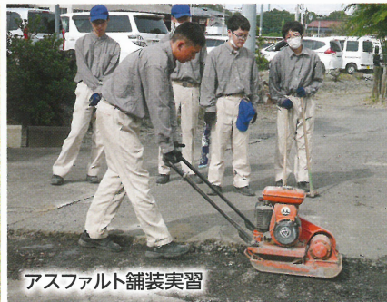
アスファルト舗装実習