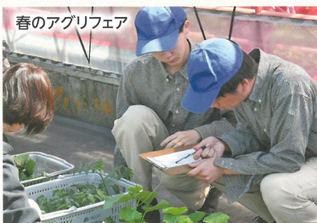
春のアグリフェア