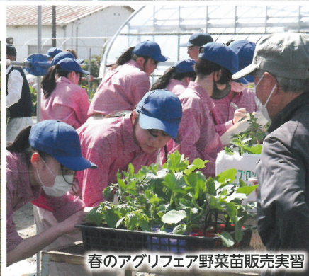
春のアグリフェア野菜苗販売実習