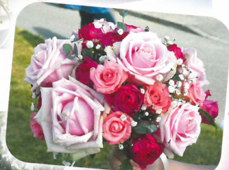
ウェディングブーケ