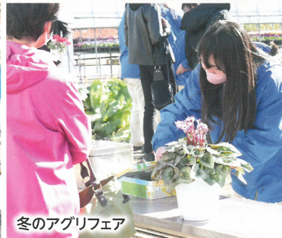
冬のアグリフェア