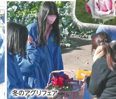
冬のアグリフェア