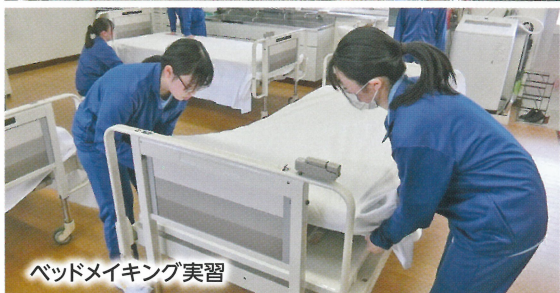
ベッドメイキング実習