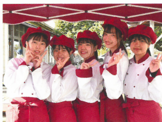
販売実習ココット