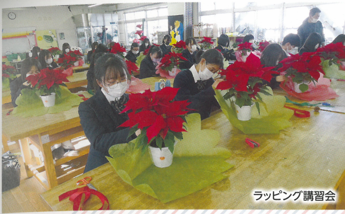
ラッピング講習会