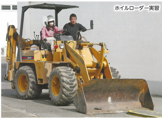
ホイローダー実習