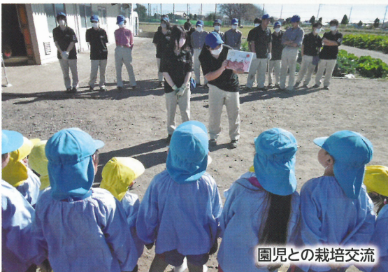
園児との栽培交流