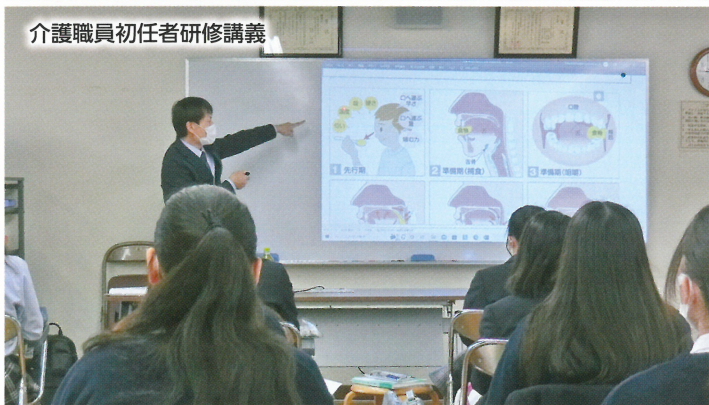
介護職員初任者研修講義