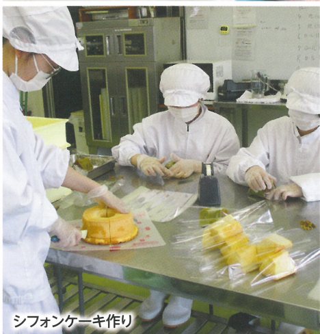
シフォンケーキ作り