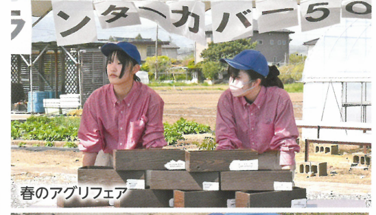
春のアグリフェア