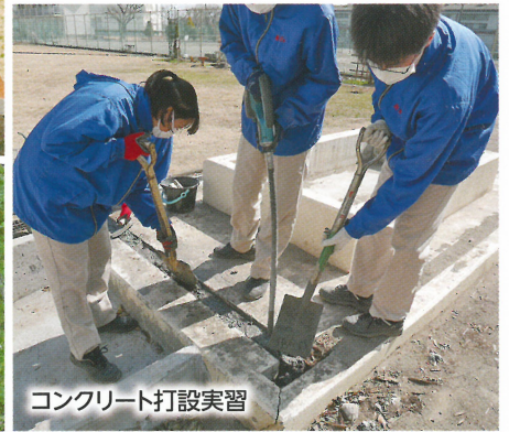
コンクリート打設実習